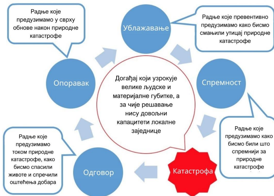
Слика 1: Циклус управљања ризиком од катастрофа

Ови циљеви усмерени су на свеобухватно планирање за све фазе циклуса ризика од природних катастрофа, тако да МЗ Сталаћ може дати приоритет акцијама и управљати ресурсима за ублажавање, припрему, одговор и опоравак од будућих катастрофа.